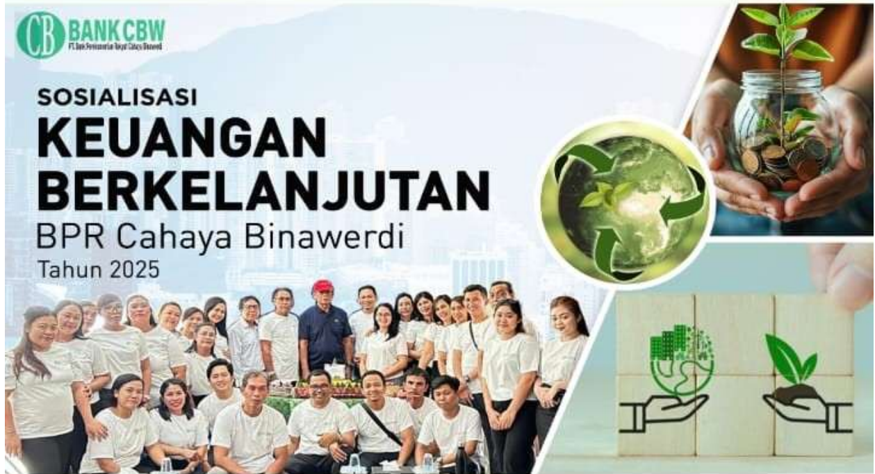
Foto sosialisasi Keuangan Berkelanjutan